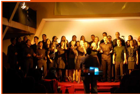
Primeiro ensaio do ano será realizado no próximo sábado 7

Lançado no primeiro semestre de 2008, o Coral Jovem da Igreja de Boa Viagem, hoje, é composto por aproximadamente 50 coristas. Além das músicas, o Coral tem a meta de realizar ações de assistências missionárias e sociais. No final do último ano, ainda realizou o seu I Recital.