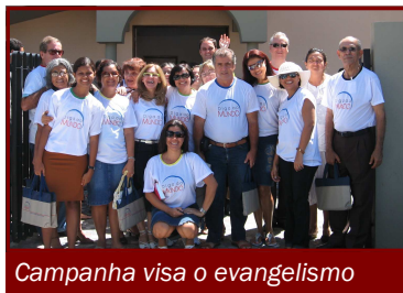
Campanha visa o evangelismo

Projeto da Igreja de Boa Viagem, o Diga ao Mundo será retomado no próximo dia 14 de fevereiro. A segunda edição da campanha mantém a meta de evangelizar os lares próximos à congregação. Logo, conforme os programas anteriores, a Escola Sabatina será antecipada para às 8h, e a distribuição de mil exemplares do livro